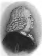
Gerard van Swieten.